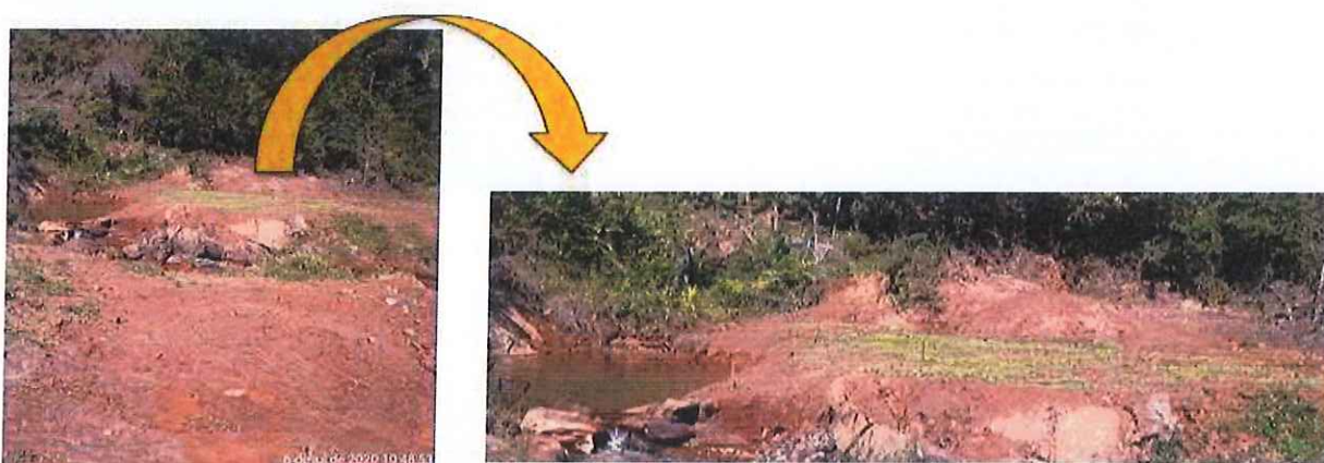
RESULTADO DA GERMINAÇÃO DO PLANTIO , SENDO ELAS: COCHALHO CASCAVEL, GUANDU, PUERARIA, SOJA-PERENE, ESTILOSANTE, TREMOÇO BRANCO, ERVILHAÇA, PEGA-PEGA E TREVO BRANCO.