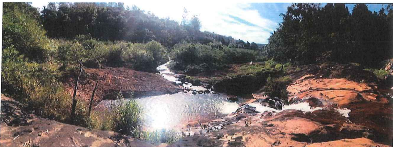
ÁREA APÓS FINALIZADAS AS INTERVENÇÕES